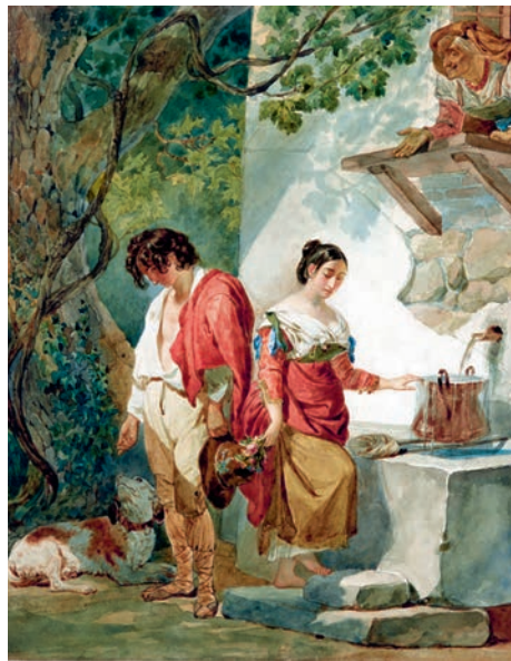
3 «Карл Брюллов. Рим — Москва — Петербург»