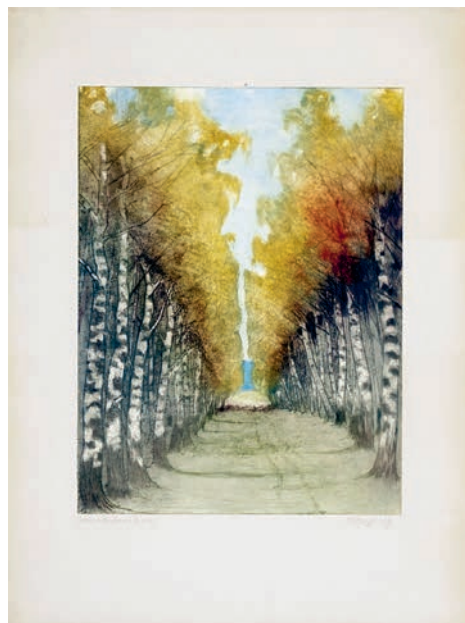
1 Елизавета Кругликова. «Березовая аллея», 1907