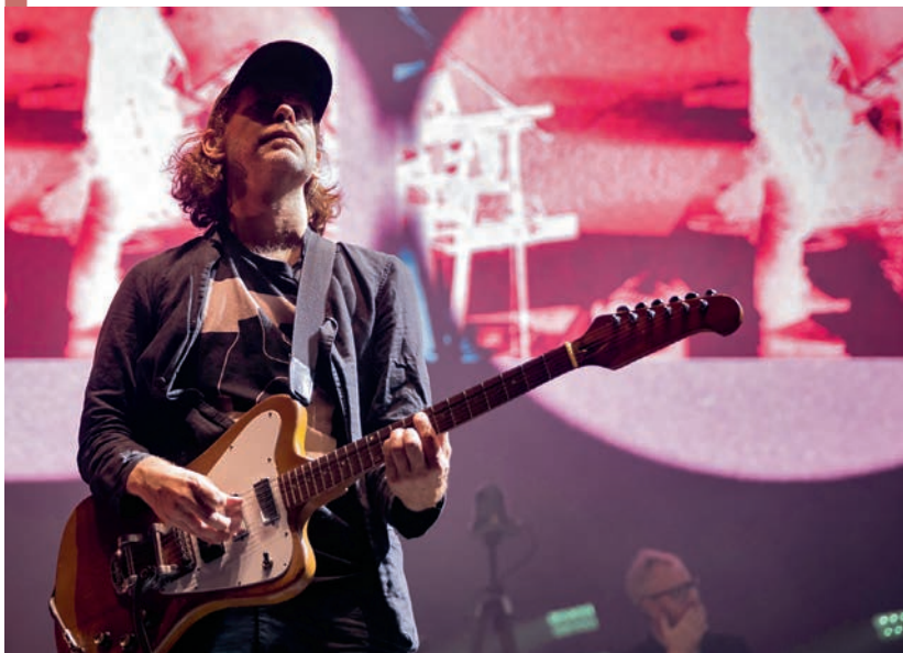
Брайс Десснер во время выступления группы The National на сцене First Direct Arena в Лидсе, Великобритания, 2023

В 2001 году, параллельно с выходом дебютного альбома The National, Десснер основал камерный ансамбль Clogs, стилистика музыки которого совмещала элементы минимализма и импровизации. После прорывного альбома «Alligator» (2005), закрепившего успех The National на американской инди-сцене, Десснер запустил в Цинциннати фестиваль MusicNOW, объединявший исполнителей из разных музыкальных миров. На одной сцене здесь встречались академические ансамбли, фолк-музыканты и электронные экспериментаторы.