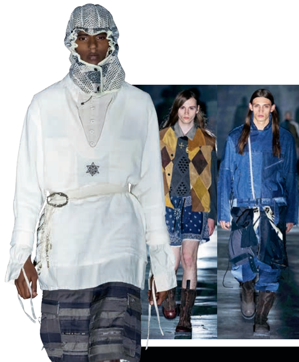
Children Of The Discordance