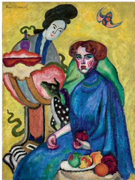
2 «Илья Машков. Авангард. Китч. Классика»

Третьяковская галерея на Кадашевской набережной До 26 октября