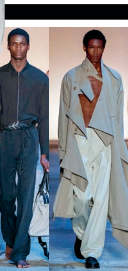
ASTRA MARINA CABRIS

датель постарались придать тот очень рафинированный лоск, который присущ именно брендам японским. Эффект получился неровный, но иногда интересный.